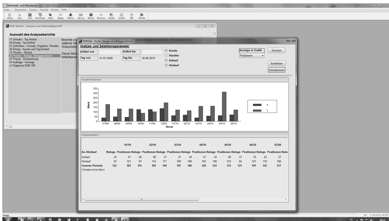
Abb. EMKStat – Analysen und Berichte zur Steuerung des Edelmetallgeschäfts

Das optionale Modul EMKDiffSt ermöglicht den in vielen Fällen vorteilhaften Einsatz der Differenzbesteuerung. Damit erhöhen Sie die Attraktivität Ihres Angebots für Ihre Kunden und verbessern Ihre Margen. EMK beherrscht sowohl das Gesamt- wie das Einzeldifferenzverfahren.